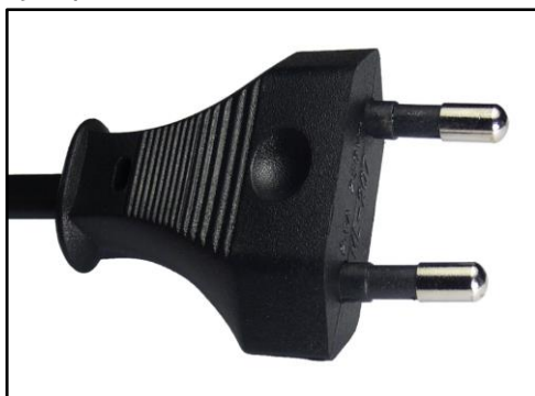
Imagen No 3 - Cable DC (6.1.4) Imágenes ilustrativas, sólo a modo de ejemplo