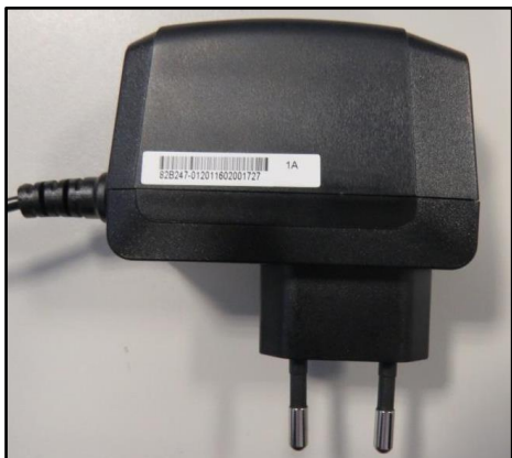
Imagen No 2 - Ficha AC Tipo europeo (CEE 7/16) (6.1.2). Imágenes ilustrativas, sólo a modo de ejemplo