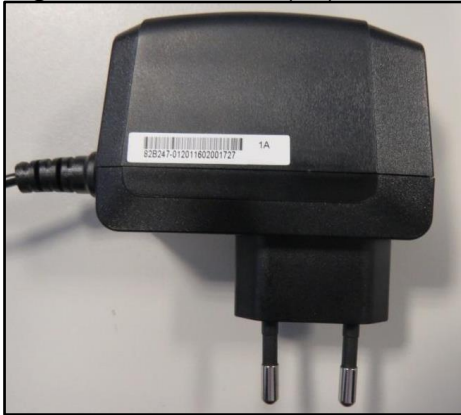
Imagen No 2 - Ficha AC Tipo europeo (CEE 7/16) (6.1.2). Imágenes ilustrativas, sólo a modo de ejemplo